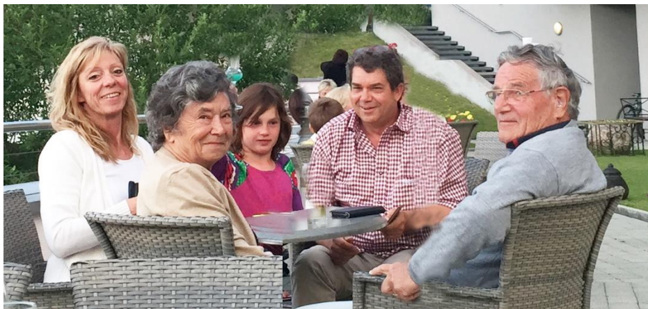
Familie Ingensand und das Zeter Berghaus Team