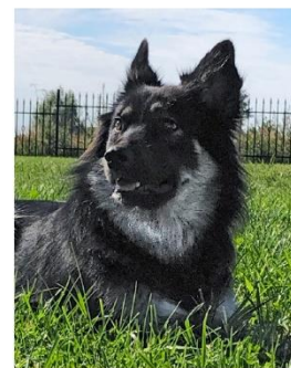
Malia Ingensand Resteverwertung