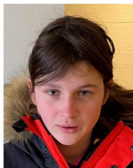
Kaya Ingensand Service